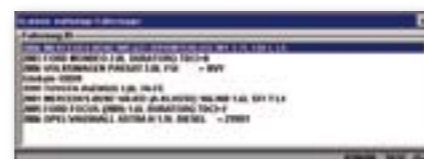
Abruf von bis zu 25 vorherigen Fahrzeugen

Mit der Funktion „Vorherige Fahrzeuge“ von SOLUS PRO™ sparen Sie in der Werkstatt Zeit. Mit welchem Fahrzeug Sie auch arbeiten, es muss nicht erneut identifiziert werden. Sparen Sie jedes Mal, wenn Sie ein Fahrzeug erneut anschließen, wertvolle Zeit.