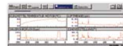
Daten in Echtzeit grafisch darstellen und aufzeichnen

Wählen Sie beim Betrachten von Echtzeit-Diagnosedaten zwischen der PID-Liste und den Grafikanzeigen für 1, 2 oder 4 Parameter aus. Speichern Sie bis zu 2.000 Datensätze, die mit dem PC angezeigt, gedruckt und an andere Anwender weitergegeben werden können.